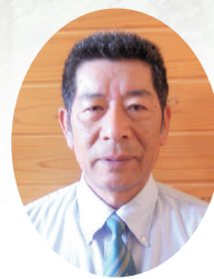
たかはら森林組合 代表理事組合長