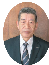
たかはら森林組合 代表理事組合長